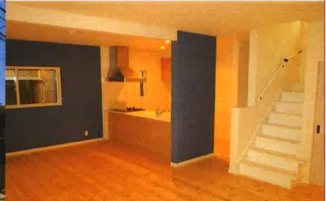
食洗機付 1,2階シャワー水洗 リビングイン階段 バルコニー2カ所 カースペース2台 1階天井高2.6M