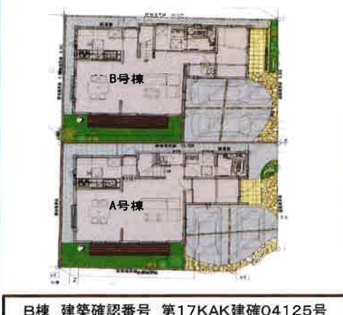
B棟 建築確認番号 第17KAK建確04125号